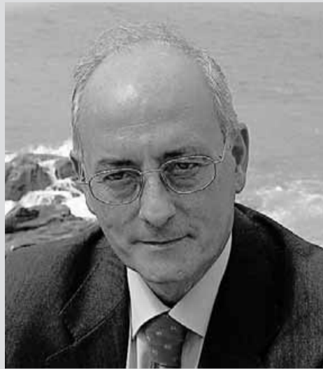
BENIGNO BLANCO ■ Presidente del Foro Español de la Familia